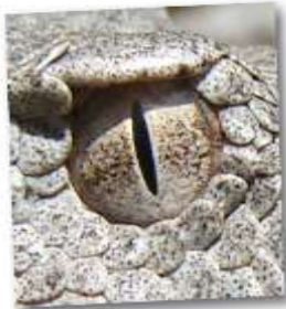
Zmije otrovnice imaju očnu zjenicu u obliku vertikalnog proreza.

U Hrvatskoj imamo trinaestak neotrovnih zmija i tri otrovne zmije i to poskoka, riđovku i planinskog žutokruga. Otrovnice prepoznajemo po cik-cak šari na leđima, trokutastoj glavi i uskom vratu, očnim zjenicama u obliku vertikalnog proreza i imaju jedan do dva šuplja zuba vezana s vrećicom punom otrova.