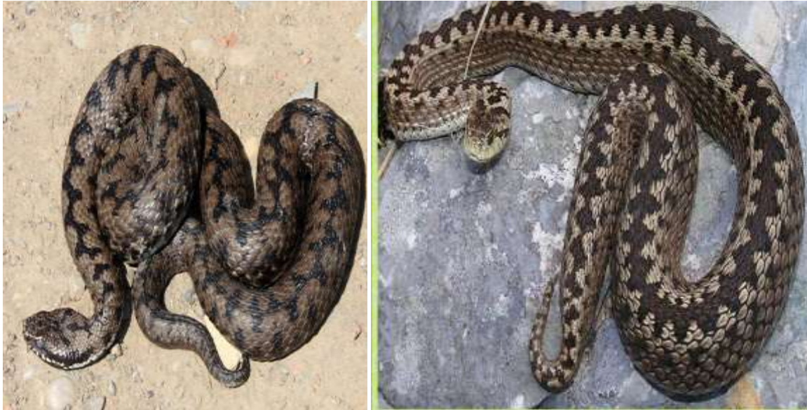
riđovka i planinski žutokrug

Zmijske otrove u grubo možemo podijeliti na hemotoksične i neurotoksične otrove.